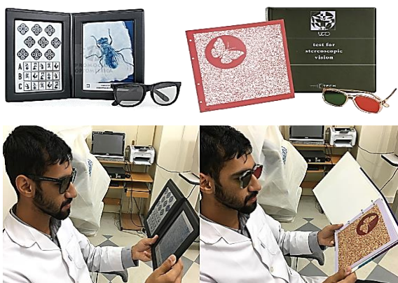
شکل ۱. نحوه انجام تست TNO (سمت راست) و Titmus (سمت چپ)

برای اندازه‌گیری استریوپسیس با تست TNO (Lameris Instrumenten, Groenekan, هلند)، ابتدا افراد عینک سبز-قرمز را همراه با کارکشن به چشم می‌زدند. سپس صفحه تست به گونه‌ای در فاصله ۳۳ سانتی‌متری قرار داده می‌شد که محور بینایی فرد عمود بر صفحه تست باشد. ابتدا دفترچه در حالت معمول قرار می‌گرفت (دیسپاریتی متقاطع) و سپس ۱۸۰ درجه می‌چرخید تا دیسپاریتی غیر متقاطع ایجاد گردد و در این حالت نیز مجدد استریوپسیس اندازه‌گیری می‌شد و نتایج بر حسب ثانیه بر کمان ثبت گردید (۱۸، ۱۷). این تست شامل نقاط تصافی می‌باشد و هیچ راهنمایی تک چشمی ندارد و از ۷ صفحه تشکیل شده است که سه صفحه اول آن صفحات غربالگری هستند (۱۸، ۱۷). به منظور اندازه‌گیری استریوپسیس با تست Titmus (Stereo Optical, Chicago, IL, آمریکا)، که جزء تست‌های لوکال است، ابتدا افراد عینک پلاریزه را همراه با کارکشن به چشم خود می‌زدند. سپس صفحه تست عمود بر صفحه عینک در فاصله ۳۳ سانتی‌متری قرار داده می‌شد. ابتدا دفترچه در حالت معمول قرار می‌گرفت (دیسپاریتی متقاطع) و سپس ۱۸۰ درجه می‌چرخید تا دیسپاریتی غیر متقاطع ایجاد گردد و در دو حالت استریوپسیس اندازه‌گیری شد و نتایج بر حسب ثانیه بر کمان ثبت گردید. لازم به ذکر است که در تمامی مراحل انجام معاینه، نور اتاق در شرایط استاندارد (۶۰۰ لوکس) (۱۸، ۱۷) قرار داشت. شکل ۱ نحوه انجام تست را در یکی از شرکت‌کنندگان نشان می‌دهد.