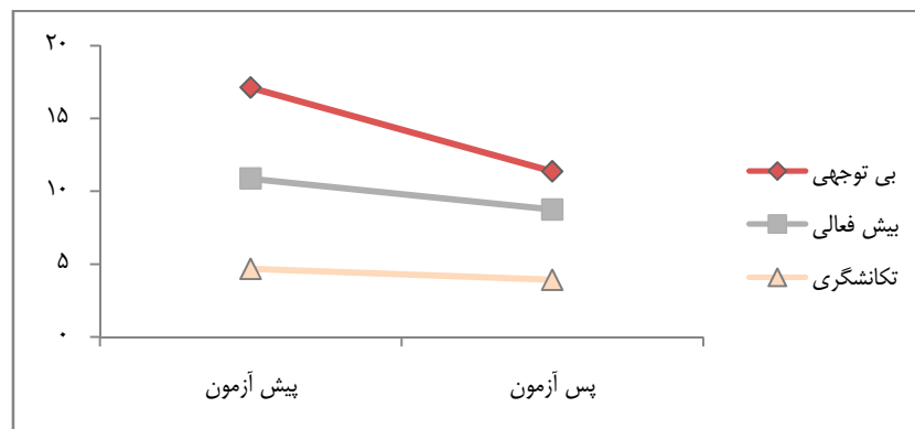
نمودار ۲. میانگین پیش‌آزمون و پس‌آزمون نقص توجه بر اساس گزارش والدین