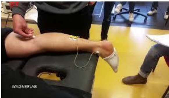
شکل ۱. آزمون اندازه‌گیری H-reflex و M-wave

MMAS سطح ساختار و عملکرد بدن، اسپاستیسیته و تون عضله با استفاده از این معیار که روایی و پایایی مناسبی دارد (۱۱)، بررسی خواهد شد. در این روش، اسپاستیسیته نمره‌ای بین صفر تا ۴ خواهد داشت و توصیف‌کننده مقاومتی است که در برابر حرکت پاسیو یک اندام در یک مفصل، در طول دامنه کامل حرکتی و در مدت زمان یک ثانیه احساس می‌شود. این آزمون در حالی انجام می‌شود که بیمار به صورت طاق‌باز و با زانوی کاملاً صاف روی تخت دراز کشیده است و فیزیوتراپیست مجرب در گرفتن این آزمون، اسپاستیسیته مچ پا را تست و بر اساس میزان سفتی که احساس می‌کند، نمره را گزارش می‌کند (۶). Hmax/Mmax Ratio، H-reflex latency و M-wave با کمک دستگاه NCV جهت ثبت عینی (Objective) مشخصات عصبی عضله اسپاستیک ثبت می‌گردد. بررسی H-reflex latency و Hmax/MmaxRatio توسط نورولوژیست باتجربه که نسبت به افراد مورد بررسی و گروه‌های درمان ناآگاه است، اندازه‌گیری خواهد شد. جهت انجام تست، بیمار به صورت دمر روی تخت به گونه‌ای می‌خوابد که پایش از لبه تخت آویزان است (۱۲). پس از آماده‌سازی پوست، عصب تیبیال در حفره پوپلیتال در حالی تحریک می‌شود که الکتروود گیرنده روی عضله گاستروکنمیوس حد فاصل مائلول داخلی و اپی‌کندیل داخلی تیبیا قرار گرفته است. الکتروود گراند نیز بین دو الکتروود تحریک‌کننده و گیرنده قرار می‌گیرد. تحریک عصب بر اساس روش Johnson و Braddom و دیورین ۱ میلی‌ثانیه و فرکانس یک تحریک در هر ۵ ثانیه انجام می‌شود و سپس بیشترین دامنه به دست آمده از H-reflex و M-wave اندازه‌گیری و H-reflex latency ثبت خواهد شد (۱۲) (شکل ۱).