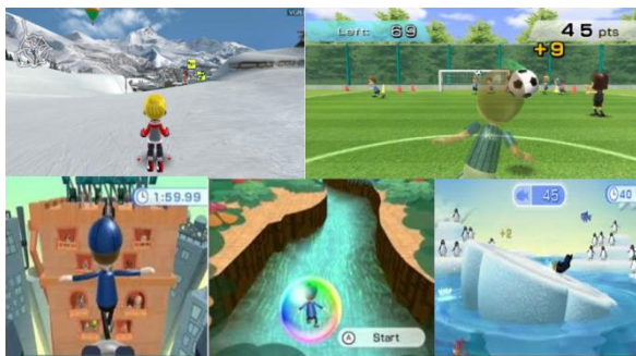
شکل ۴. بازی‌های انتخاب شده از سیستم Nintendo Wii

تصادفی‌سازی: به علت این که تعداد نمونه‌های لازم کمتر از ۱۰۰ نفر می‌باشد، از سیستم بلوک‌بندی جهت تصادفی‌سازی نمونه‌ها استفاده می‌شود. تعداد نمونه و گروه مورد نیاز که در مطالعه حاضر دو گروه می‌باشد، به نرم‌افزار ارایه خواهد شد. سپس نرم‌افزار نمونه‌ها را به صورت تصادفی در یکی از دو گروه شاهد یا مداخله قرار می‌دهد و در جدول ارایه می‌نماید.