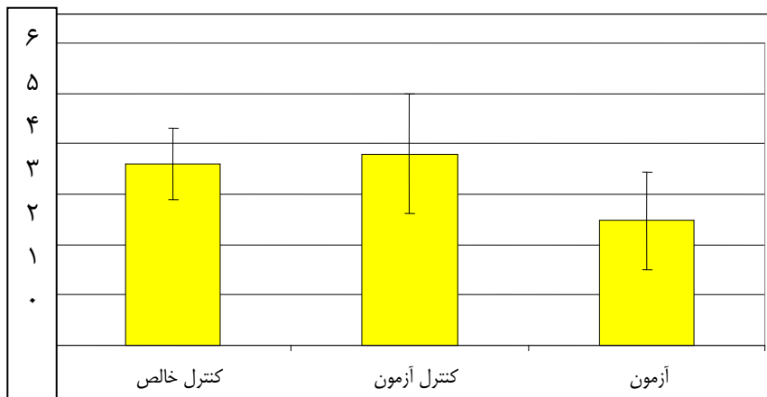
نمودار ۲. نمودار میانگین حداکثر قدرت کششی در سه گروه کنترل خالص، کنترل آزمون و آزمون

در مطالعه حاضر اثر کاپینگ بر روی لایه های مختلف به طور مجزا بررسی نشده است و همچنین تنها از یک سایز کاپ به صورت ثابت استفاده گردیده است. Tham در مطالعه خود از کاپ هایی با سایزهای مختلف استفاده نمود و به این نتیجه رسید که با افزایش قطر دهانه کاپ، استرس بیشتری بر روی لایه های مختلف پوست ایجاد می شود و بنابراین جابجایی های بیشتری در پوست نیز حاصل می گردد (۴). با توجه به آنچه گفته شد، انتظار می رود که اعمال کاپینگ با سایزهای مختلف بتواند اثرات متفاوتی را بر روی ویژگی های بیومکانیکی پوست داشته باشد. Hendriks نیز طی مطالعه ای رفتار مکانیکی لایه های درمیس و اپیدرمیس را در بدن انسان در شرایط طبیعی بررسی نمود و به این نتیجه رسید که با کاهش قطر کاپ، تأثیر ساکنش بر روی لایه پاییلاری درمیس بیشتر می باشد و با افزایش قطر، هم لایه پاییلاری و هم لایه رتیکولار درمیس به داخل کاپ کشیده می شوند (۱۴). بر اساس یافته های حاصل از این مطالعات ما نیز انتظار داریم که در صورت استفاده از کاپ هایی با سایز بزرگ تر، احتمالاً تغییرات بیومکانیکی پوست و لایه های مختلف زیرین نیز بیشتر باشند که اثبات آن نیاز به بررسی بیشتر دارد.