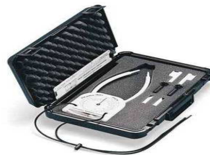
شکل ۱. تیلت‌سنج Palpation meter

گرفتن تقریب که از دست برود و برای اطمینان بیشتر ۶۰ هر گروه سنی در نظر گرفته شد (۱۰). پس از انتخاب افراد در مورد روش کار توضیحاتی داده شد و آن‌ها پس از امضای رضایت‌نامه وارد مطالعه شدند. در این مطالعه برای ارزیابی به ترتیب مراحل زیر انجام شد. از آنجایی که تیلت لگن در دو طرف یکسان می‌باشد، تیلت لگن به صورت یک طرفه و به وسیله تیلت‌سنج (PALM Palpation meter (St. Paul Performance attainment associates, Minnesota, USA) و در سمت راست اندازه‌گیری شد (شکل ۱) (مشابه مطالعات قبلی انجام شده در این زمینه که تیلت را یک طرفه اندازه‌گیری کرده‌اند). به این صورت که فرد مورد مطالعه در حالتی که پاهایش را به اندازه عرض شانه‌هایش باز کرده بود در حالت ایستادن راحت قرار گرفت. تیلت‌سنج طوری تنظیم شد که دو سر آن روی خار خاصه قدامی فوقانی (در حد L 5 ) و خار خاصه خلفی تحتانی (در حد S ۳ به فاصله ۳-۲ بند انگشت از خط وسط) باشد. زاویه شاقول تیلت‌سنج نشان دهنده تیلت لگن بود (۱۰، ۸). در مطالعات قبلی تکرارپذیری Test-retest تیلت‌سنج Palpation meter با r = 0.87 و P = 0.010 عالی گزارش شده است (۳).