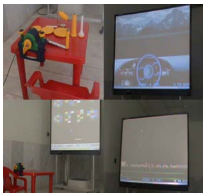
شکل ۱. سیستم واقعیت مجازی E-link

نحوه‌ای تعاملی سبب افزایش انگیزش و تحمل انجام بازی‌های مختلف می‌گردد. صفحه نمایش این سیستم در این تحقیق بر روی یک صفحه بزرگ و توسط یک ویدئو پروژکتور ارایه می‌گردد. فیدبک شنوایی نیز توسط اسپیکر ارایه می‌شد. ابزار ساخت‌افزاری که توسط آن کودک می‌توانست با محیط درون سیستم و بازی‌های مختلف ارتباط برقرار کند، شامل تمرین دهنده اندام فوقانی مخصوص این سیستم بود (E-link upper limb exerciser: E3000)، که قابلیت تنظیم و تطبیق با توانایی‌های کاربر بر اساس ۵ ویژگی نوع دستگیره، قدرت، دامنه حرکتی، مدت زمان و سرعت را دارا بود (شکل ۱).