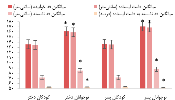
شکل ۲. میانگین متغیرهای قامتی در چهار گروه آزمودنی

بر اساس نتایج آزمون Least Significant Difference (LSD)، تفاوت معنی‌داری بین کودکان دختر و پسر در قد خوابیده ( P = 0/584 )، قامت ایستاده ( P = 0/350 ) و قد نشسته ( P = 0/902 ) وجود نداشت، اما تفاوت معنی‌داری بین نوجوانان دختر و پسر با هم و با کودکان دختر و پسر مشاهده شد ( P < 0/001 ). آزمون Dunnett T3 نشان داد که تفاوت بین قد نشسته به قامت ایستاده کودکان دختر و پسر ( P = 0/134 )، نوجوانان دختر و کودکان پسر ( P = 0/018 ) و کودکان دختر با نوجوانان دختر ( P = 0/948 ) معنی‌دار نبود. شکل ۲، نمای هیستوگرام قد خوابیده، قامت ایستاده، قد نشسته و قد نشسته به قامت ایستاده را نشان می‌دهد که با نتایج آزمون‌های تعقیبی LSD و Dunnett T3 در سطح اطمینان ۹۵ درصد برای آزمودنی‌ها به تفکیک جنسیت و گروه سنی هماهنگی داشت. مقادیر واقعی با نوار خط (Error bar) در شکل مشخص شده است.