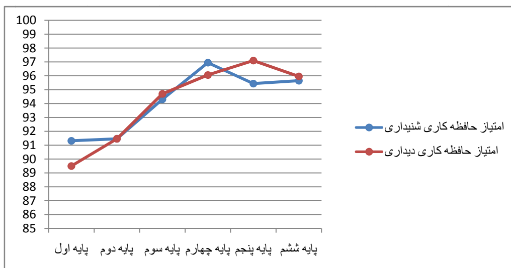
نمودار ۱: امتیاز حافظه کاری شنیداری و دیداری در پایه های تحصیلی