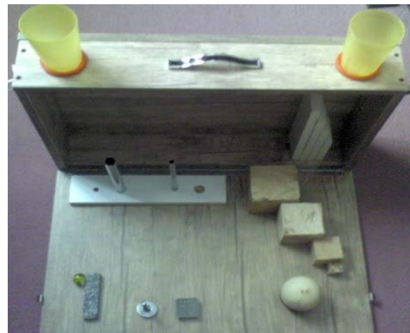
شکل ۱- وسایل ارزیابی Action Research Arm Test

این آزمون یک آزمون مشاهده ای است که برای ارزیابی بهبود عملکرد اندام فوقانی به دنبال صدمه کورتیکال مورد استفاده قرار می‌گیرد و شامل ۴ زیرآزمون Grasp, Grip, Pinch, Gross movement می‌باشد و در کل شامل ۱۹ آیتم که به ترتیب سختی مرتب شده اند می‌باشد و هر آیتم از ۰-۳ نمره دهی می‌شود مجموع کل نمره ۵۷ می‌باشد. (۱۸-۱۴). با توجه به اینکه امکان خرید ابزار فراهم نگردید از روی اندازه های موجود در مورد وسایل آزمون ابزارهای مورد نیاز تهیه گردید، و توسط دو نفر از اساتید کاردرمانی مورد تایید قرار گرفت. وسایل ارزیابی مورد استفاده در شکل ۱ نشان داده شده است.