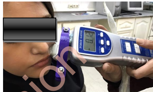
شکل ۱. اندازه‌گیری ابعاد ناحیه Nasolabial Fold (NLF) با استفاده از دستگاه اولتراسوند

(Ultrasonix Medical Corporation، کانادا) با مبدل خطی L۴۰-۸/۱۲ و قدرت تفکیک ۰/۰۰۱ میلی‌متر، فرکانس ۴۰ مگاهرتز و عمق نفوذ ۲ سانتی‌متر اندازه‌گیری شد. اپلیکاتور دستگاه سونوالاتوگرافی به صورت طولی بر روی NLF قرار گرفت (شکل ۱) و محل اندازه‌گیری آن وسط خطی بود که گوشه لب را به ریشه غضروف آلاب بینی وصل می‌کرد. هم‌زمان با تصویربرداری، عمق NLF بر حسب میلی‌متر محاسبه گردید و به عنوان معیاری جهت تنظیم و همسان‌سازی مقیاس نرم‌افزار ImageJ (مؤسسه ملی سلامت آمریکا) مورد استفاده قرار گرفت.