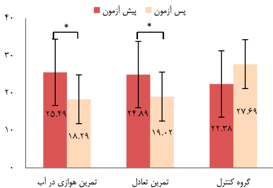
نمودار ۲. مقادیر میانگین پیش آزمون و پس آزمون سلامت روانی در گروه‌های تحقیق

*تفاوت‌های معنی‌دار را در سطح ۰/۰۱ نشان می‌دهد.