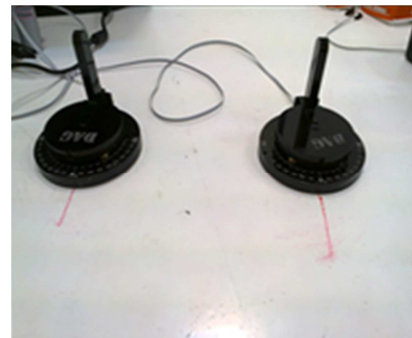
شکل ۱. دستگاه هماهنگی دو دستی مچ دست

برای لرزش تاندون‌های عضلات خم کننده مچ دست و مسدود کردن حس عمقی نیز از یک دستگاه لرزاننده ساخت مؤسسه فرهنگی ورزشی پدیدار امید فردا (مرکز رشد و فن‌آوری دانشگاه شهید بهشتی تهران، ایران) استفاده شد. این دستگاه به وسیله دو مچ‌بند به طور همزمان به هر دو مچ (تاندون عضله خم کننده) شرکت کننده متصل می‌شد. مساحت سطح سر لرزاننده به گونه‌ای طراحی شده بود که تماس مطلوبی با پوست ایجاد می‌کرد. این دستگاه شامل صفحات موتور، موتورهای لرزاننده کوچک (شرکت پاناسونیک، ژاپن) با ابعاد 0/59 \times 0/79 \times 1/50 سانتی‌متر و فرکانس ۱۵۰ هرتز، میله متصل به موتور آهنربای ثابت DC و تحریک کننده‌هایی برای لرزش بود. میزان تحریک دستگاه لرزاننده بر اساس تحقیقات پیشین (۱۷، ۱) تعیین شد. به منظور حذف سیگنال‌های بینایی، بینایی شرکت کنندگان با کمک چشم‌بند پارچه‌ای مسدود شد تا آزمون‌ها در وضعیت‌های بدون بینایی نیز انجام شود. همچنین، پخش موزیکی با ریتم ابتدا سریع و سپس آهسته (متضاد با ریتم ضرب‌آهنگ) برای مختل کردن شنوایی افراد مورد استفاده قرار گرفت.