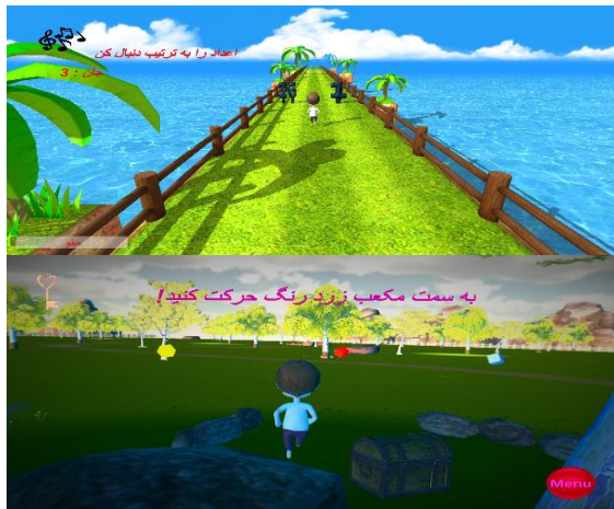
شکل ۳. گزیده‌های از مراحل بازی

تکالیفی که در این بازی به شرکت‌کنندگان ارائه گردید، به طور مداوم در حال تغییر بود تا از ایجاد عادت و کسالت در سالمندان جلوگیری شود. قبل از شروع هر مرحله، دستورالعمل‌های آن مرحله توسط درمانگر خوانده شد و از آزمودنی‌ها درخواست گردید بازی را تا زمانی که شکست بخورند، ادامه دهند و در صورت شکست، از ابتدای بازی شروع کنند.