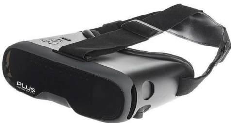
شکل ۴. هدست واقعیت مجازی

هدست واقعیت مجازی: یکی از نوآوری‌های پژوهش حاضر، نمایش بازی رایانه‌ای روی گوشی تلفن همراه و مشاهده آن به کمک یک هدست واقعیت مجازی بود. در مطالعه حاضر از هدست واقعیت مجازی مدل Dream Vision Plus (شرکت New Magic، چین) استفاده شد. این هدست امکان تماشای ویدئوهای معمولی یا سه بعدی و همچنین، بازی‌های فراگیر و ۳۶۰ درجه را به کاربر می‌دهد و دارای هدفون سرخود است که با رابط ۳/۵ میلی‌متری به گوشی موبایل وصل می‌شود. این هدست واقعیت مجازی حدود ۳۸۱ گرم وزن دارد و برای گوشی‌های موبایل ۳/۵ تا ۶ اینچی مناسب می‌باشد که در محدوده ۸۲ تا ۱۵۴ میلی‌متر قرار می‌گیرند. قسمتی که مخصوص نگهداری گوشی موبایل است، به صورت کشویی باز و بسته می‌شود. همچنین، قسمتی که روی صورت قرار می‌گیرد، نرم است تا در طولانی‌مدت برای کاربر ناراحتی ایجاد نکند و به وسیله بندهای تعبیه شده به خوبی روی سر و صورت محکم می‌شود. این هدست امکان تنظیم لنزها را نیز برای کاربر فراهم کرده است تا به بهترین وضوح تصویر برسد و شیارهای جانبی روی آن جابه‌جایی هوا را ممکن می‌سازد تا روی لنزها بخار ایجاد نشود. این هدست برای کاربران سیستم عامل iOS و اندروید مناسب است (شکل ۴).